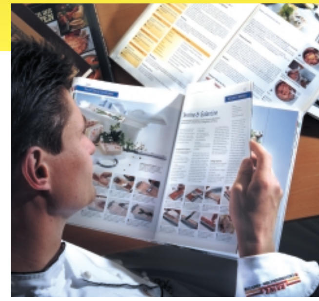
Anregungen holen: Fachbücher und Fachzeitschriften sind eine wahre Fundgrube rund um das Basiswissen und neue Ideen für Schauplatten. Für eine Vertiefung der Grundtechniken lohnt sich der Blick in eines der bekannten Standardwerke.