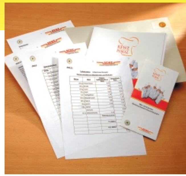
Ausschreibung prüfen: Je sorgfältiger die einzelnen Anforderungen in der Wettbewerbsausschreibung gelesen und je genauer sie interpretiert werden, desto größer ist letztlich auch die Chance auf eine spätere hohe Punktzahl für das eigene Exponat.