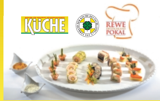
Das Ergebnis unserer Serie ist diese Schauplatte zum Thema „Variation vom Süßwasserfisch“