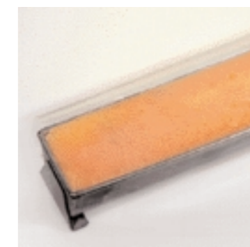
Terrinenform füllen (4): Je ebenmäßiger und glatter die letzte Schicht in die Form eingefüllt wird, desto schöner ist die spätere Gesamtform der Einzelportion.

S ie gehört zu den Klassikern auf jeder Schauplatte und ist aus einem Kochkunst-Wettbewerb wie der Konkurrenz um den REWE Deutschland-Pokal überhaupt nicht wegzudenken: die Terrine. Aufwändig gefüllt, mehrfarbig komponiert und in Schichten und Farcen aufeinander abgestimmt, zählt sie zu den Highlights einer Platte. Die Basis einer jeden Terrine sind immer die Farcen – im Unterschied zu Galantinen (ganzes Tier) und Rouladen (Filets).