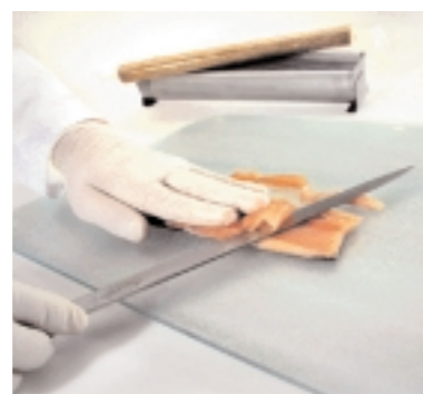
Filet zuschneiden: Als spätere seitliche „Wand“ dient ein Forellenfilet, das zuvor auf jeden Fall sauber geputzt und sorgfältig in Form gebracht werden muss.