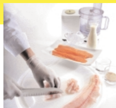
Farce herstellen: In der Küchenmaschine gehen Fischfilets und Sahne zu gleichen Teilen eine cremige Verbindung ein - auf keinen Fall die Gewürze vergessen!