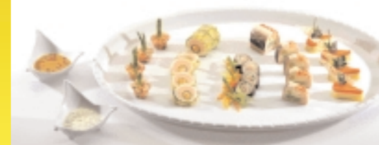
Das Ergebnis unserer Serie ist diese Schauplatte zum Thema „Variation vom Süßwasserfisch“