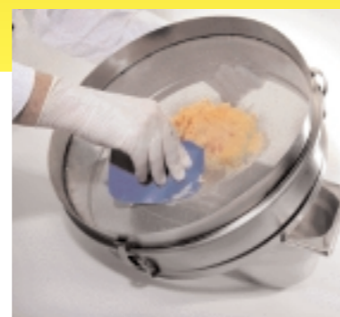
Farce durchstreichen: Zugegeben, ein wenig mühsam, aber absolut notwendig ist das Durchstreichen der Farce, um eine gleichmäßige Konsistenz zu erreichen.