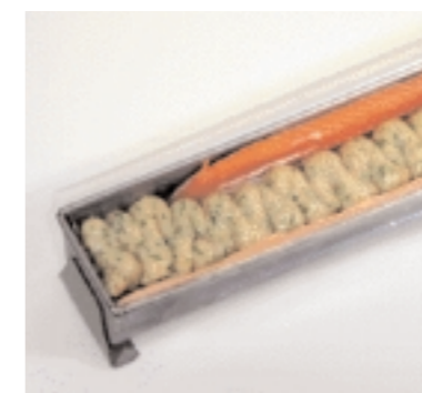
Terrinenform füllen (3): Das gleichmäßige Verteilen der unterschiedlichen Farcen in der Form ist der Garant für ein später optisch perfektes Schnittbild.