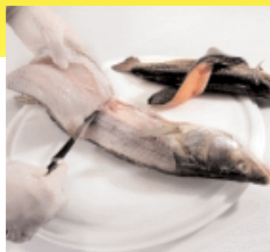
Fisch filetieren: Ob beim Zander (vorn) oder Saibling - das Lösen des Filets von der Gräte ist der erste wichtige Schritt bei der Herstellung einer jeden Farce.