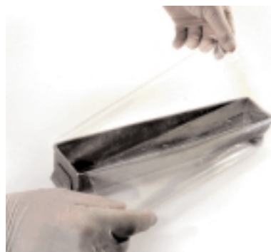
Terrinenform vorbereiten: Wer die feste Folie für die Form vorher etwas anfeuchtet, vermeidet ein späteres Verschieben beim Einfüllen der einzelnen Schichten.