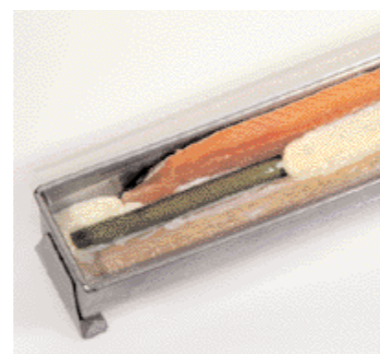
Form füllen (1): Ein folienumwickelter Holzstab sorgt nach dem Garen für einen Hohlraum, der später mit Schmand/Aspik und Krebschwänzen dekoriert wird.