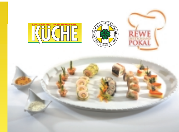
Das Ergebnis unserer Serie ist diese Schauplatte zum Thema „Variation vom Süßwasserfisch“

im Detail. Basis bildet stets ein es überhaupt füllen zu können