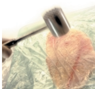
Filet plattieren: So bekommt das Filet die notwendige Form und Fläche.