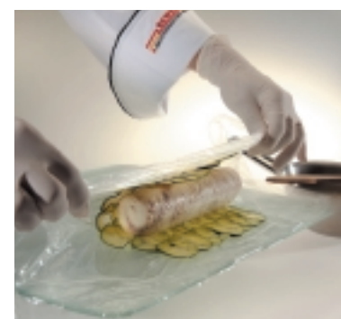
Roulade fertigstellen: Gut gekühlt auf Gemüse aufsetzen und fest aufwickeln.

Arbeiten Sie am besten direkt auf Folie, sie gibt die nötige Stabilität und wird zum Aufrollen gleich mitgenutzt.