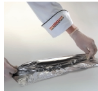
Roulade schließen: Alles vorsichtig, aber fest einwickeln und gut verschließen.