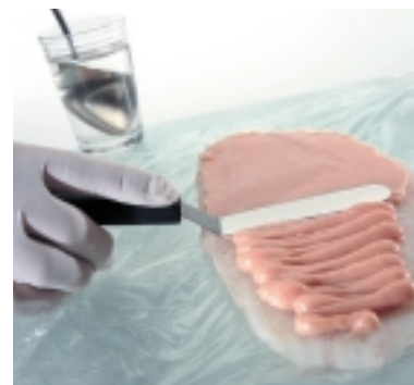
Filet mit Farce bestreichen: Hauptsache, es ist glatt und gleichmäßig.