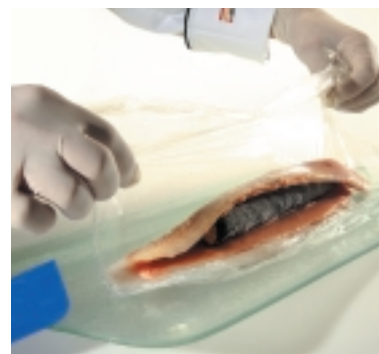
Kern einfüllen: Am allerbesten direkt aus der Tiefkühlung entnehmen.